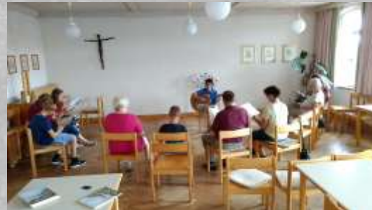
Offenes Singen für alle