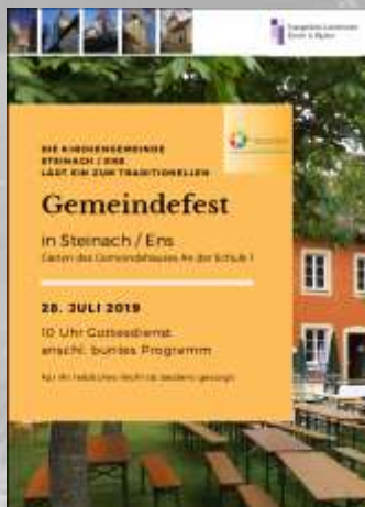
Plakate luden zum Fest ein