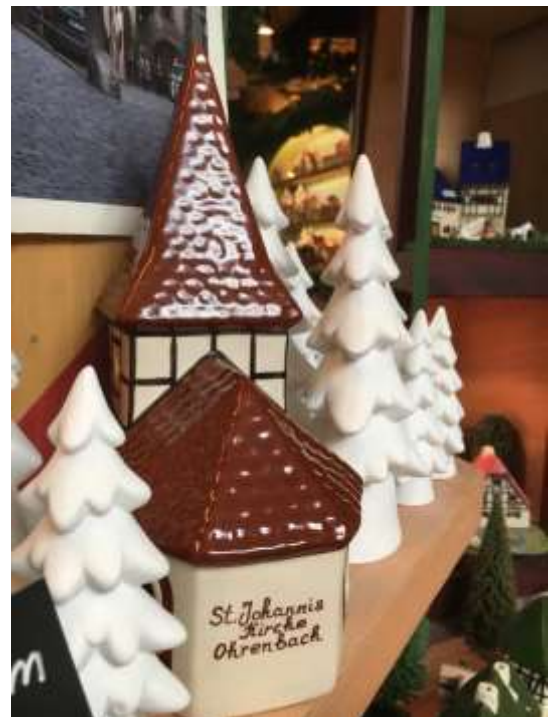
Das Lichthausmodell der St. Johannis-Kirche Ohrenbach steht im sehenswerten Ausstellungsraum der Leyk Lichthäuser GmbH in Rotenburg.

Hierzu werden wieder alle Kirchengemeinden der Pfarrei Ohrenbach-Steinach sehr herzlich eingeladen.