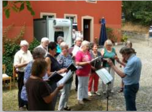
Der Singkreis Steinach in Aktion