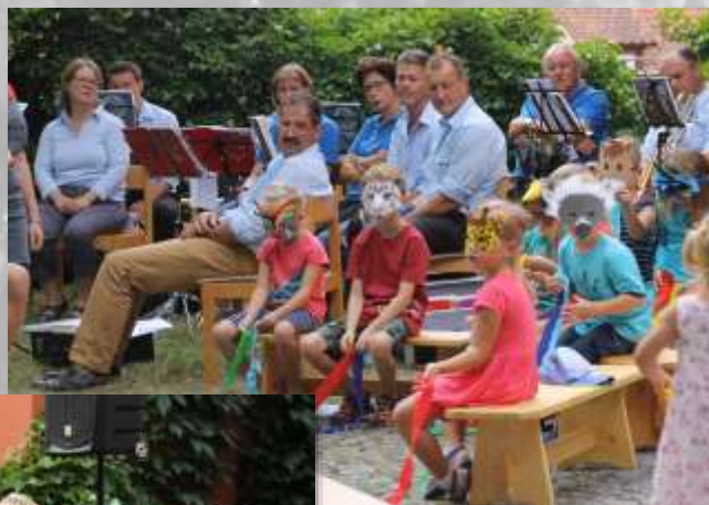
Der Kindergottesdienst führte das Singspiel „Noah unterm Regenbogen“ auf

Besonderer Dank gilt all den ehrenamtlichen Helferinnen und Helfern, ohne deren unermüdlichen Einsatz solch ein Fest nicht möglich wäre.