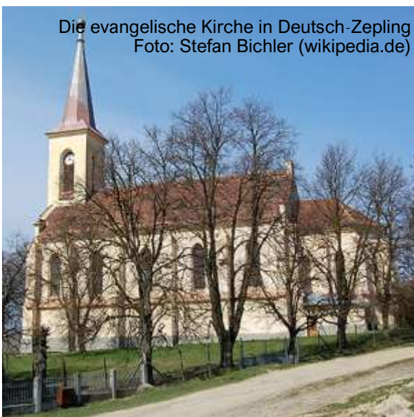
Die evangelische Kirche in Deutsch-Zepling