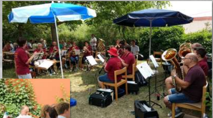
Oben: Auftritt der Blaskapelle Steinach Links: Posaunenchor Mörlbach im GoDi