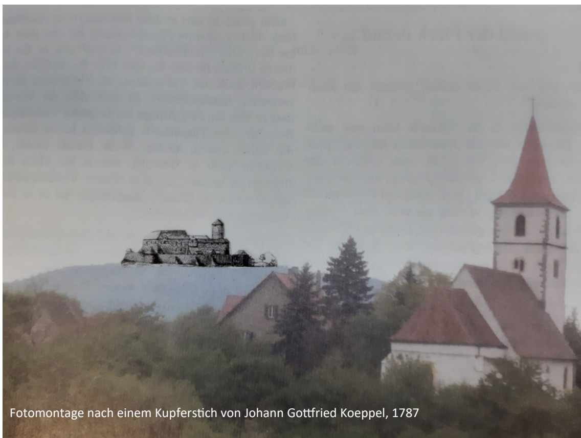
Fotomontage nach einem Kupferstich von Johann Gottfried Koeppel, 1787

Vielleicht haben Sie es sich auch schon gedacht, als Sie auf der Straße nach Endsee unterwegs sind. Den Endseer Berg sieht man doch von allen Seiten. Und wenn Sie einmal einen Spaziergang hinauf gemacht haben, dann können Sie die Steinreste entdecken, die von der früher an dieser Stelle gestandenen Endseer Burg zeugen. In einer Fotomontage wurde sie nachgestellt, so dass man von dem Umfang und Größe eine Ahnung bekommen kann. Deswegen hieß es früher auch einmal Steinach unter (der Burg) Endsee .